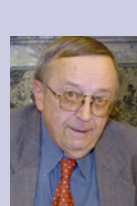
Karel Čermák - expředseda České advokátní komory