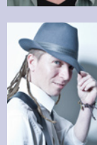
Ivan Bartoš - předseda České pirátské strany